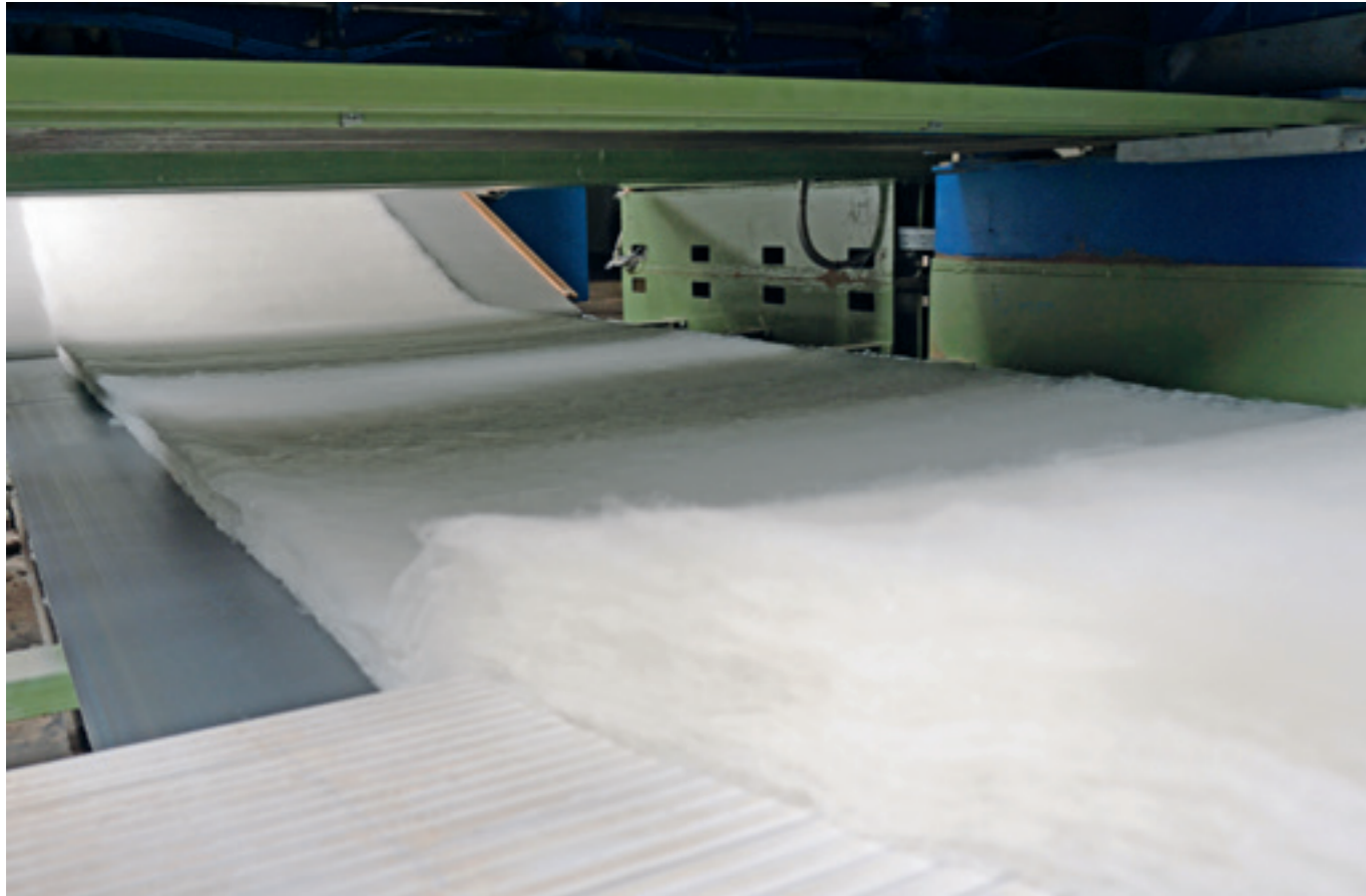
lavalan® insulation before the thermal bonding process lavalan® Isolierung vor der thermischen Verfestigung