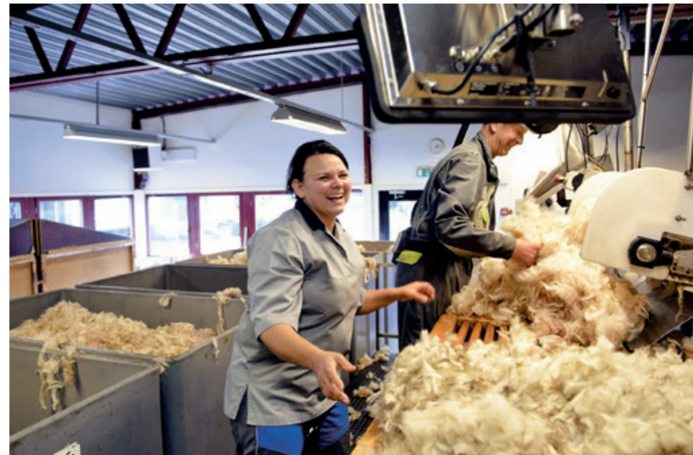
At the grading station in Gol wool is sorted by the Norwegian wool standard into 16 different qualities In der Woll-Sortierstation in Gol wird die Wolle nach dem Norwegischen Wollstandard in 16 verschiedene Qualitäten sortiert