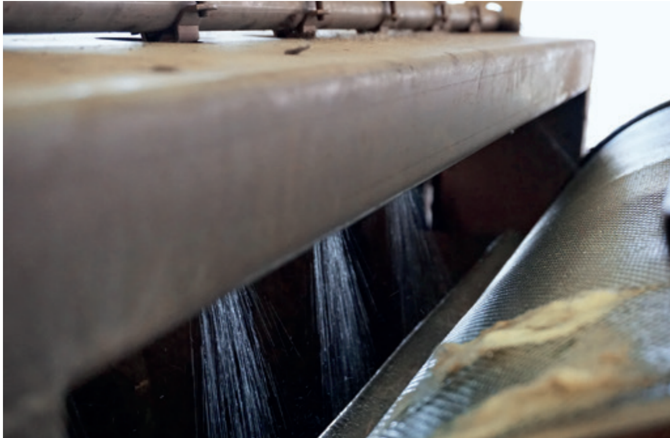
Wool scouring with water and soda soap only Unsere Wolle wird nur mit Wasser und Seife gereinigt