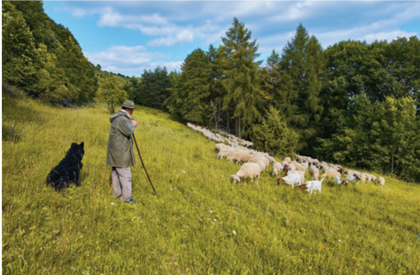
Sheep keeping in Germany (near Dinkelsbühl – where lavalan® is produced) Schafhaltung in Deutschland (in der Nähe von Dinkelsbühl, wo lavalan® produziert wird)