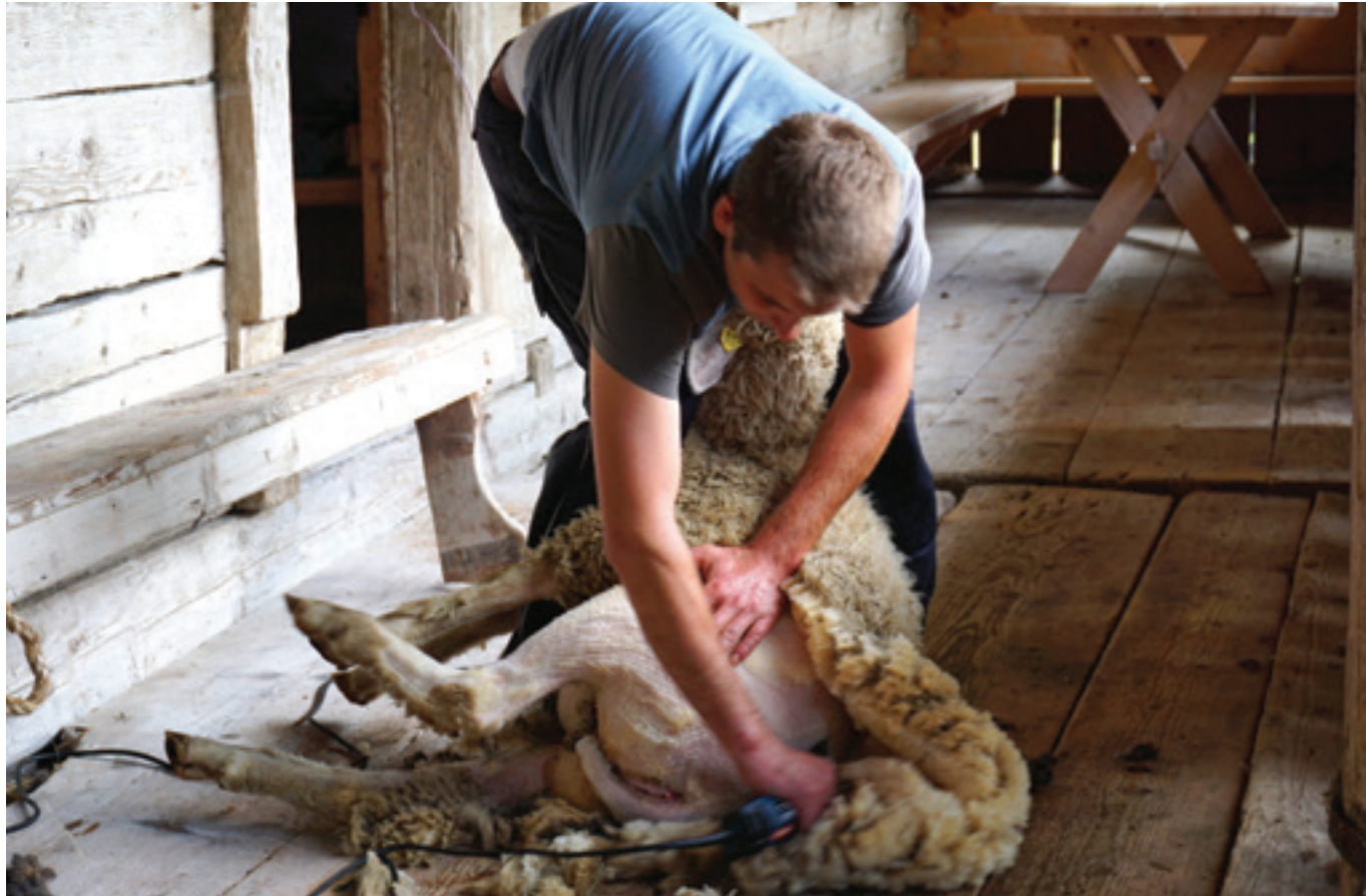
Sheep shearing - once or twice a year in spring and autumn Schafe werden ein bis zwei mal pro Jahr geschoren – im Frühling und im Herbst