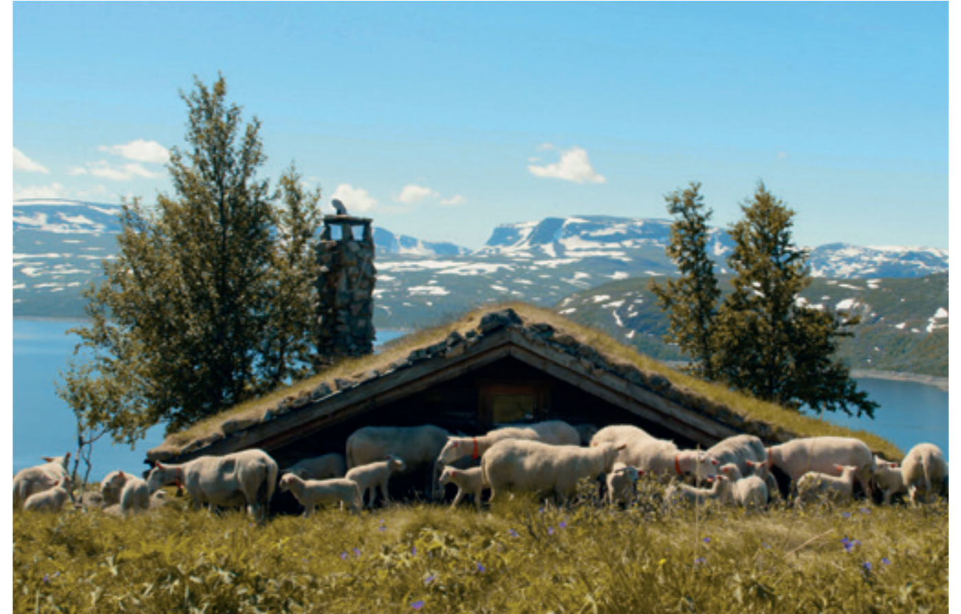
Ewes give birth to an average of two lambs per year (picture taken in Norway) Mutterschafe gebären durchschnittlich zwei Lämmer pro Jahr (Bild aufgenommen in Norwegen)