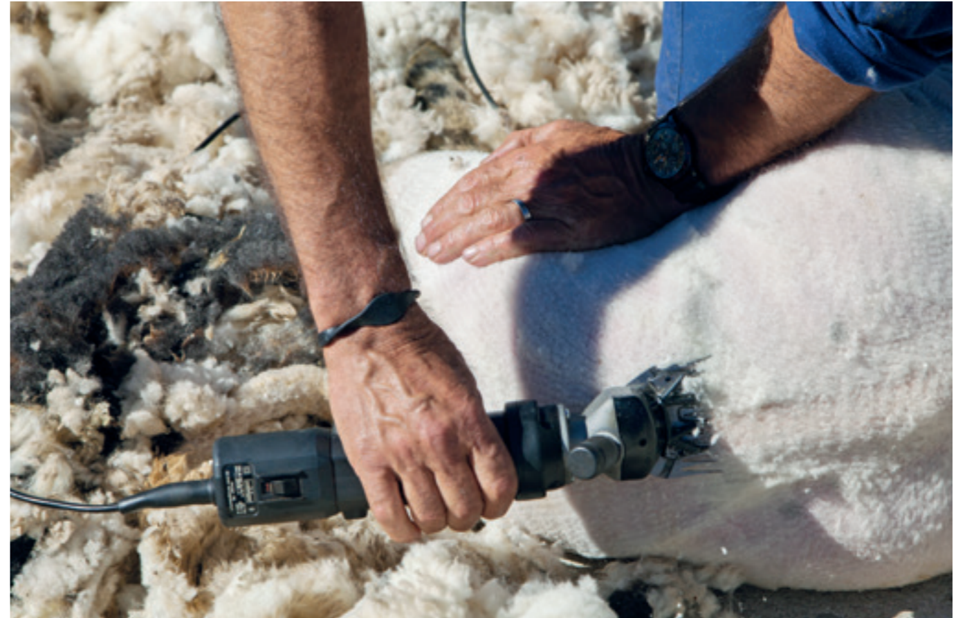
Sheep are always treated with care and respect Die Schafe werden immer artgerecht und mit größter Sorgfalt gehalten