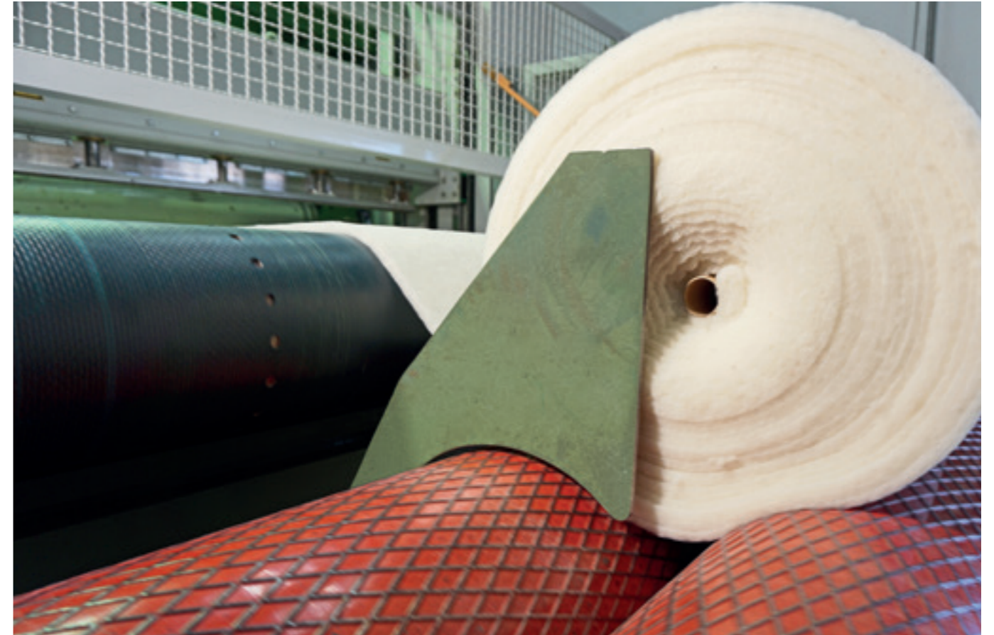
lavalan® as rolled goods ready for shipment Versandbereite lavalan® Rolle