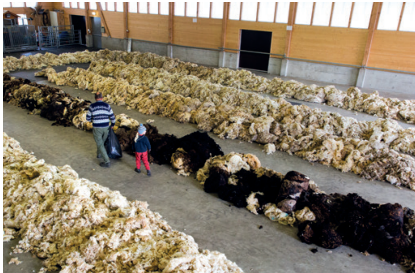
Wool collection point in Switzerland - wool is sorted by different qualities and colors Wollsammelstelle in der Schweiz - die Wolle wird nach verschiedenen Qualitäten und Farben sortiert