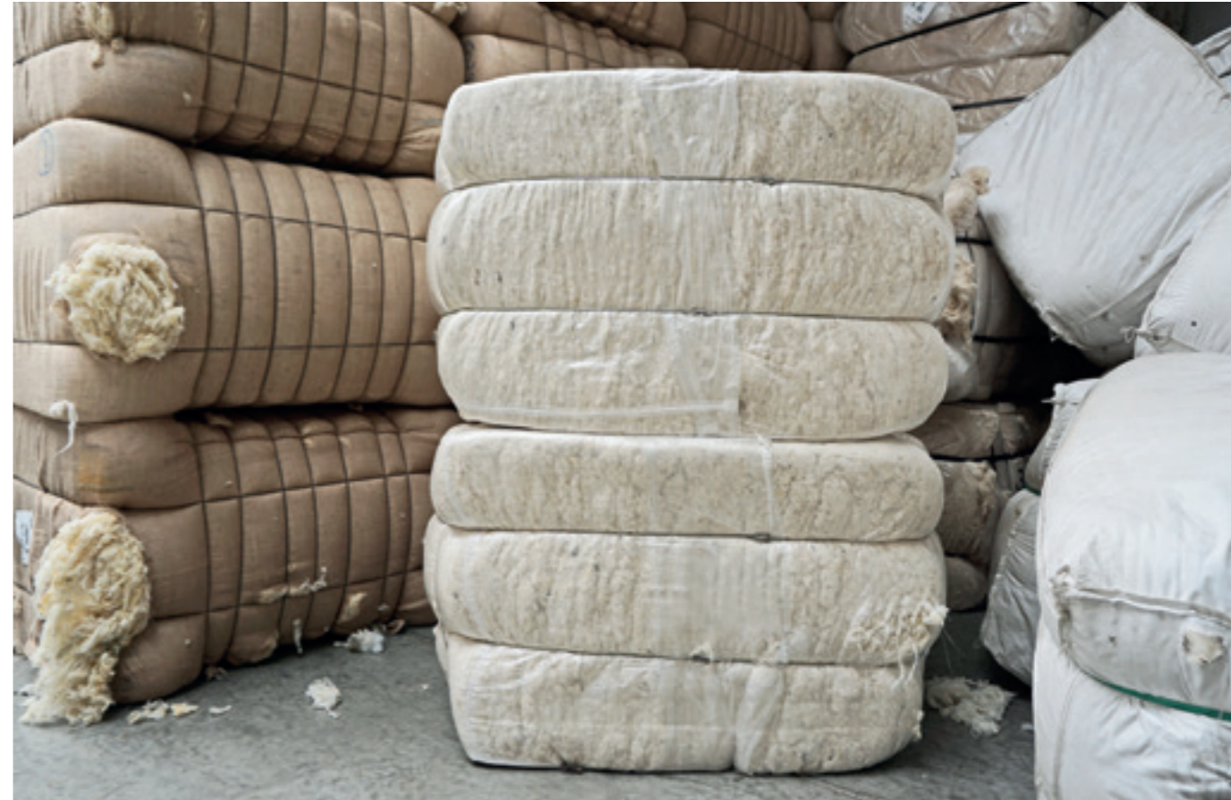
Wool bales at our lavalan® production site in Germany Wollballen in unserer lavalan® Produktion in Deutschland