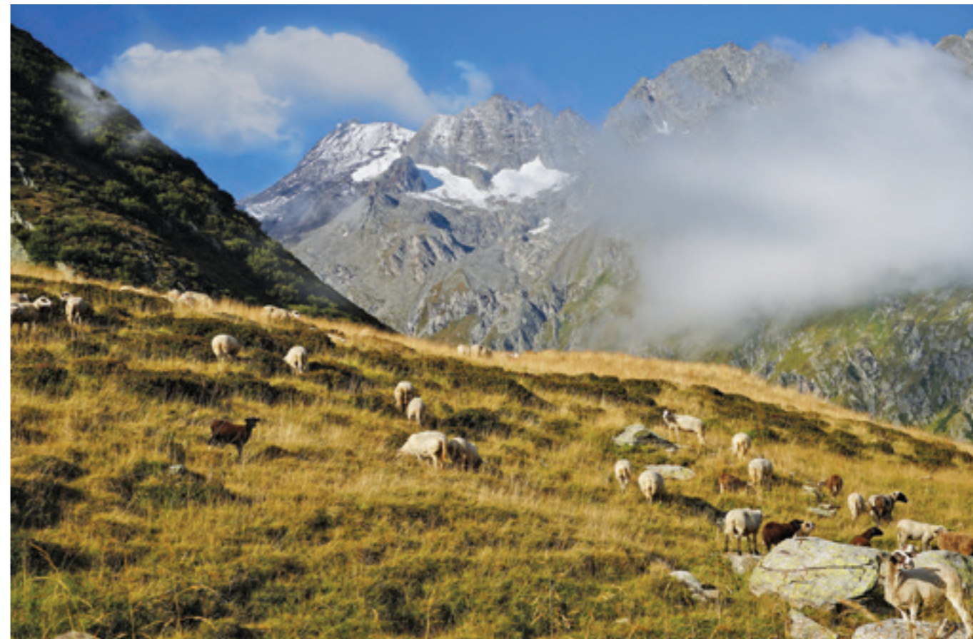
Grazing sheep on Alp Cristallina (Switzerland) Grasende Schafe auf der Alp Cristallina (Schweiz)

lavalan is solely produced in Germany wird ausschließlich in Deutschland hergestellt